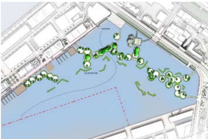
Een mogelijke toekomstvisie voor het Rijnhavenpark

Honderden mensen hebben het Paviljoen bezocht. DeltaSync zoekt mensen die geïnteresseerd zijn in wonen op het water. Bent u dat? Meld u vrijblijvend aan op www.deltasync.nl .